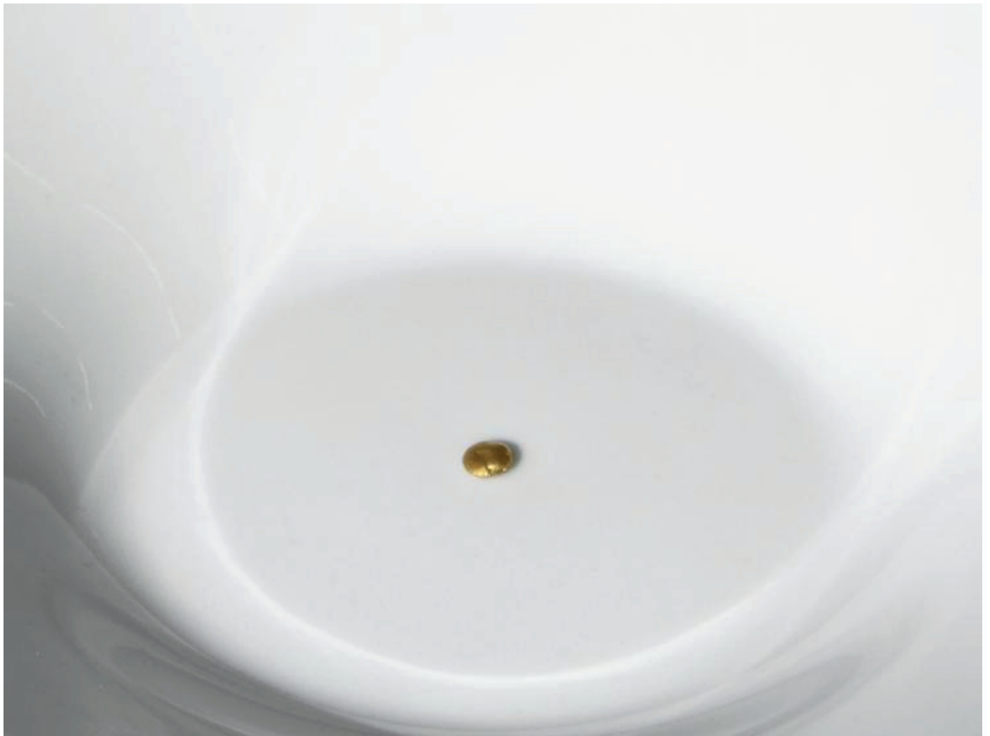
Stéphanie Saadé détail de Contemplating an Old Memory , 2017 24-carat gold cast of a lentil seed, live lentil sprout of the same seed, plates, iron, water dimensions variable