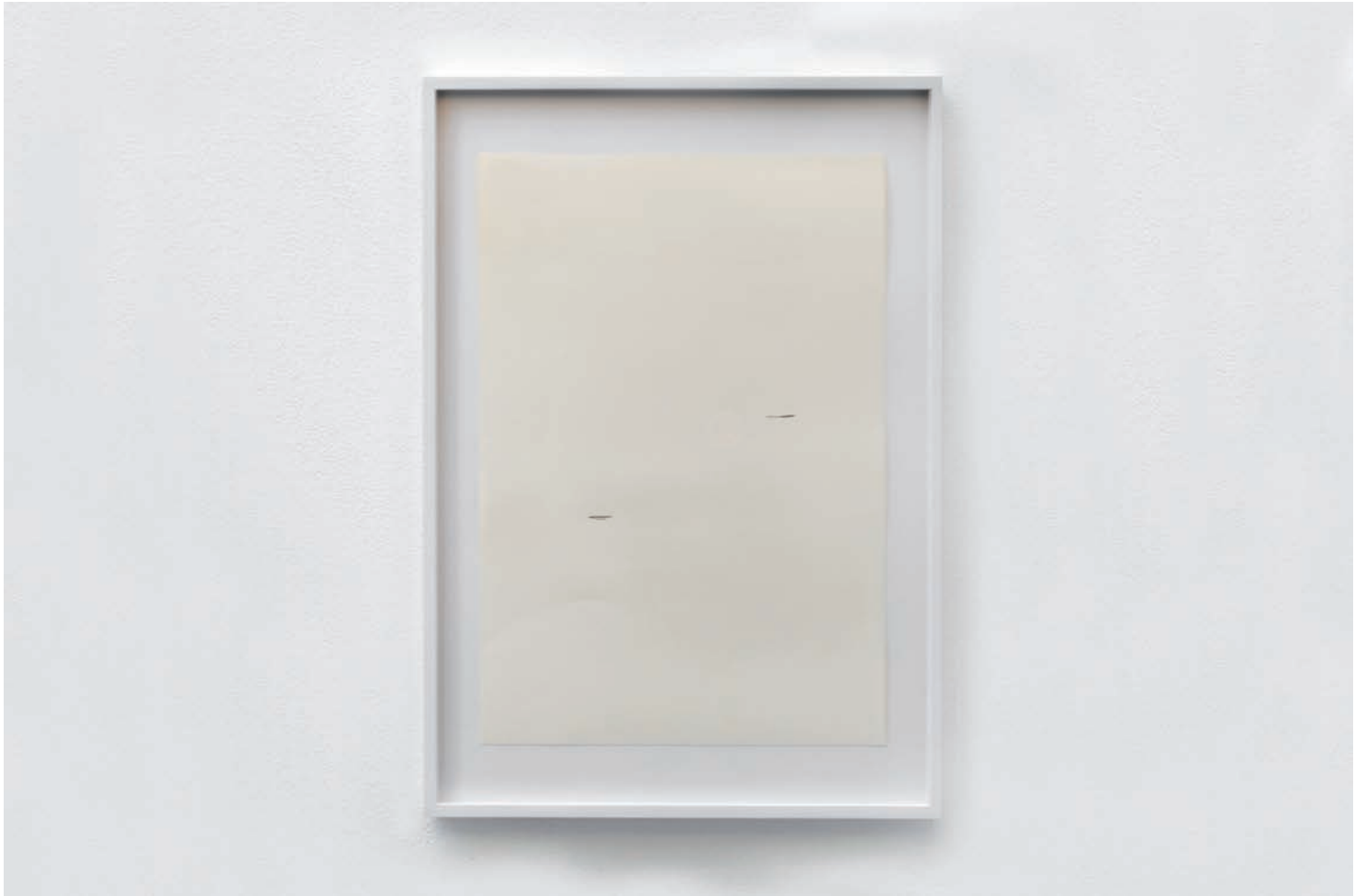
Stéphanie Saadé Double Altitude , 2017 mine sur papier 27 x 40 cm