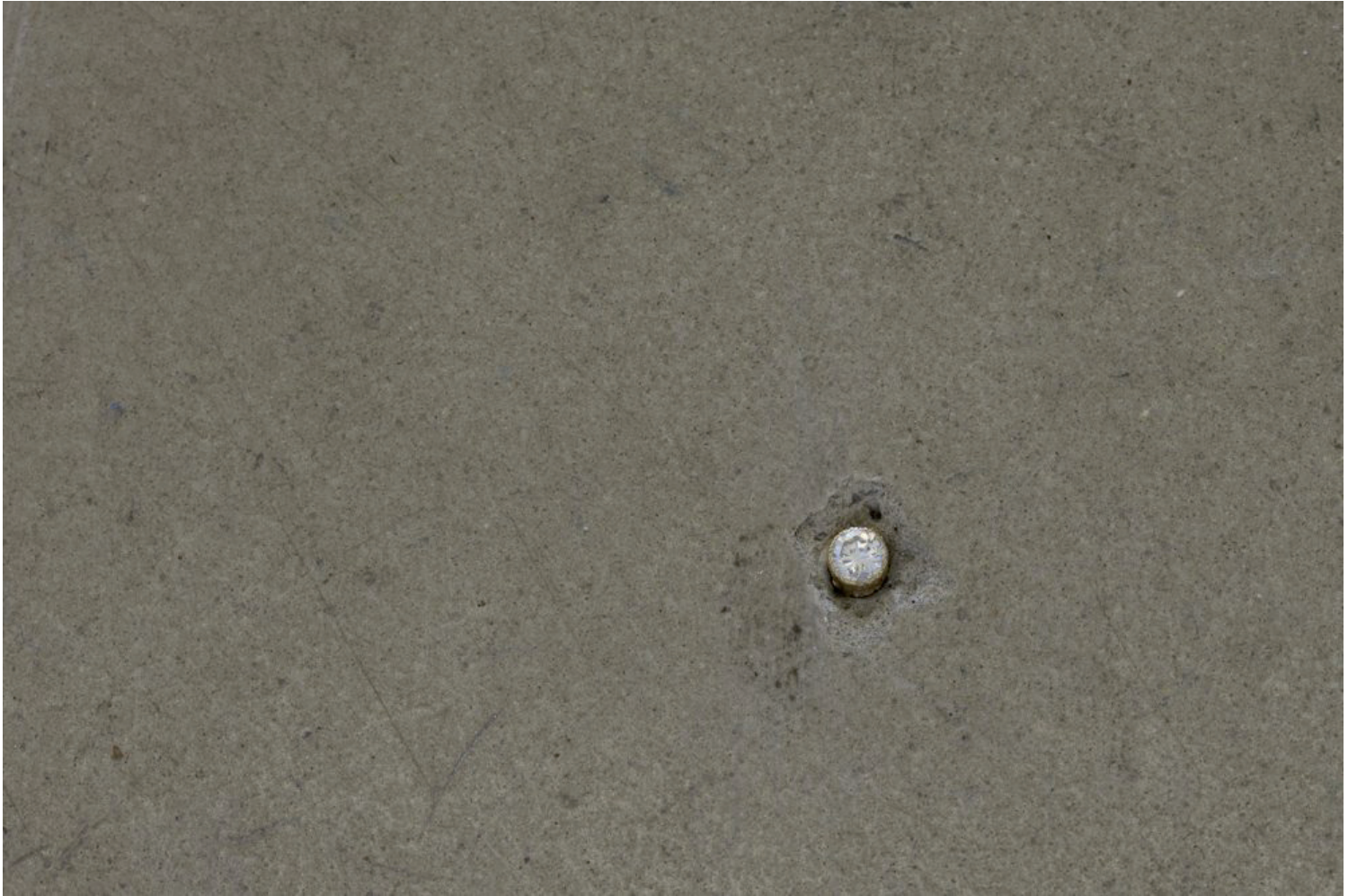
Stéphanie Saadé Thin ice , 2018 boucle d'oreille en diamant