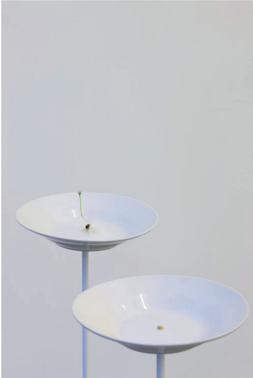
Stéphanie Saadé Contemplating an Old Memory , 2017 24-carat gold cast of a lentil seed, live lentil sprout of the same seed, plates, iron, water dimensions variable