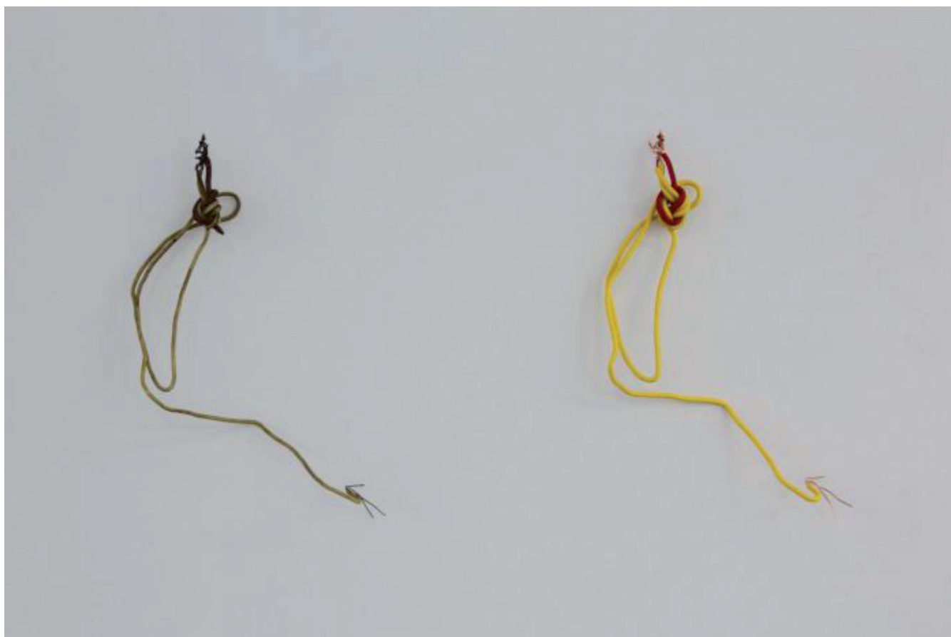
Stéphanie Saadé Logic Remains , 2014 Found cables and latches, new cables and latches Various dimensions