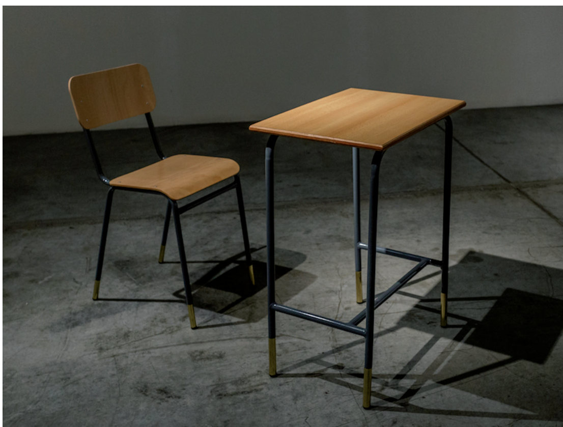
Stéphanie Saadé The Shape of Distance , 2016 Table, chaise, laiton 127 x 77 x 55 cm